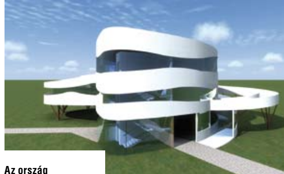
Az ország legnagyobb kerékpáros centruma épül Tiszafüreden

A Tiszavirág Ártéri Sétányt üzemeltetője, a Szabics Kikötő idén tavasszal az Örvényi Pákász Tan-